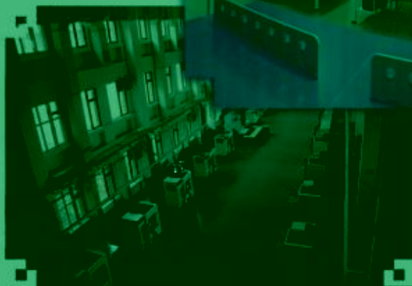
DMC 数控技术 训练场所